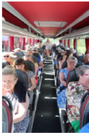
Een volle bus.