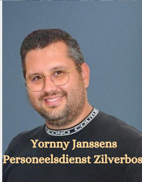
Yornny Janssens Personeelsdienst Zilverbos